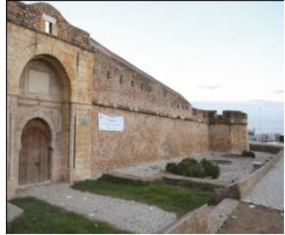
قلعة العثمان التي تحتضن مركز المعلومات والتنقيف بالأراضي الرطبة في غار الملح (تونس)

وفي الوقت الحاضر توجد مراكز التنقيف بالأراضي الرطبة في كل القارات باستثناء القطب الجنوبي حيث تنتشر هذه المراكز من جنوب القارة الأفريقية (مركز إنجولا للزوار ، جنوب أفريقيا) إلى أقصى شمال أوروبا (مركز ليمينجنلاتي للزوار ، فنلندا) ومن قلب روسيا المحاط باليابسة (حديقة ميشرا الوطنية، روسيا) إلى المناطق الساحلية الدافئة بآسيا (مركز ناجيناهايرو للتعليم البيئي، سريلانكا) ومن الغابات الاستوائية في أمريكا الجنوبية ( مركز نابو للحياة الفطرية ، الإكوادور) إلى صحاري شبه الجزيرة العربية (مشروع مركز القرم للمعلومات البيئية، سلطنة عمان) والمناطق النائية الأسترالية (نافذة مركز الأراضي الرطبة للزوار ، استراليا).