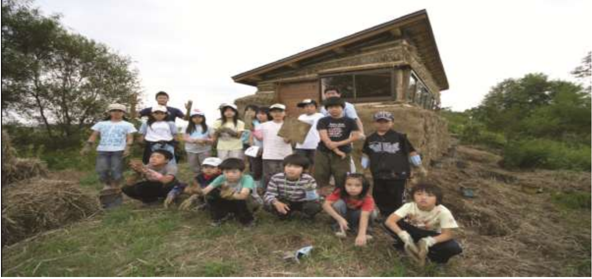
متطوعون يبنون مخبأ لمراقبة الطيور في مياجيمانوما في اليابان

وفي المواقع التي تشهد مواسم حارة وجافة يجب التفكير في تنظيم الفعاليات في المساء عندما تقل درجة الحرارة مثل مشاهدة النجوم أو مشاهدة الحياة البرية مثل الخفافيش واليراعات (الخنافس المضيئة). ويمكن استغلال أوقات إغلاق المركز في صيانة المركز كتنظيف بعض المناطق وتحديث المعارض إذ يصعب إجراء الصيانة أثناء وجود الزوار. ويسمح هذا النهج للحملة التسويقية التي يتم إعادة إطلاقها موسمياً بجذب اهتمام الزوار المتكررين.