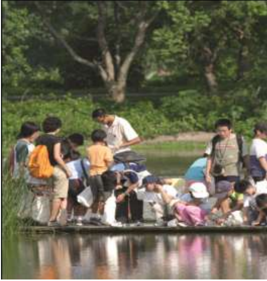
طلاب يتعلمون على ممشى مائي

http://www.wwf.org.hk/en/getinvolved/gomaipo/