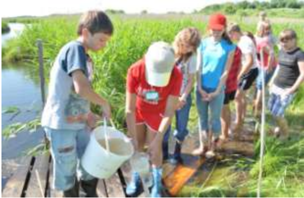
مدرسة بيئية في حديقة مورافيوفا ، روسيا

*التعلم شامل لجميع المناهج و القطاعات، حيث يمكن أن تلهم الأراضي الرطبة التعلم في جميع المواضيع من الفن إلى علم الحيوان ومن التاريخ إلى الفيزياء.