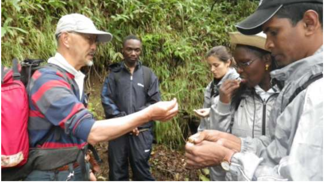
برنامج تدريبي في مجال السياحة البيئية ، الأرض الرطبة كوشيرو-شيتسوجن