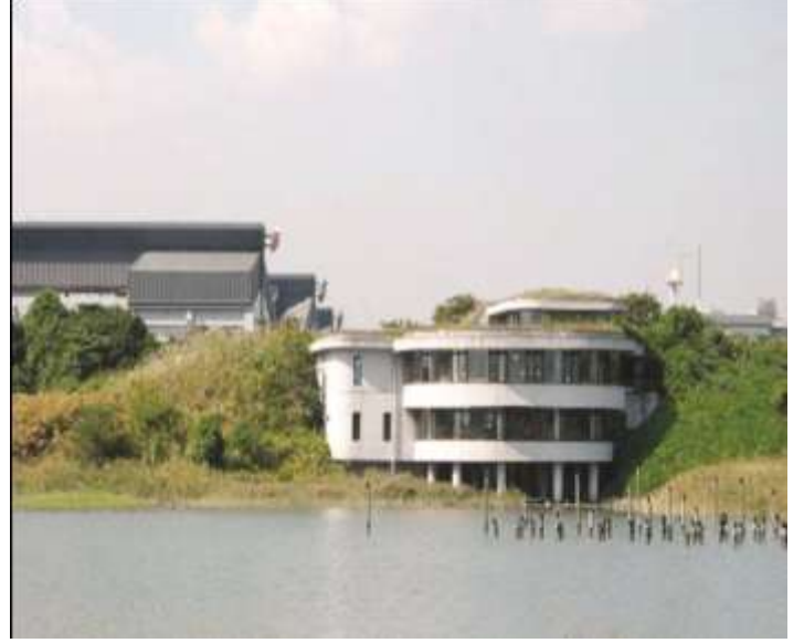
حديقة الطيور البرية بميناء طوكيو

تطويرها مثل رحلات السفاري على زوارق الكنو أو نزول البرك. فمثلاً يمكن إدماج الأراضي الرطبة في تصميم المبنى لمعالجة مياه الصرف الصحي أو إدارة مخاطر الفيضانات أو إنشائها لتحسين القيم الجمالية للمناظر الطبيعية وصنع مناظر رمزية من المنشآت المبنية بحيث تندمج بشكل جيد مع الموقع. ومن المهم النظر في توقيت الأعمال الخاصة بإدماج الموائل. ولكي يتسنى للموائل أن ترسخ وتنمو بشكل تام يجب إتمام إنشاء أو إصلاح الأراضي الرطبة والأنظمة البيئية المرتبطة بها قبل أعمال البناء بوقت كاف. وفي حالات أخرى قد يحدث اضطرابات موسمية للموائل الحساسة من قيام بعض أنشطة التطوير.