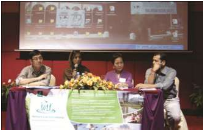
مندوبون بترأسون حلقة نقاش في إجتماع آسيا الثالث للرابطة العالمية للأراضي الرطبة (ماليزيا)