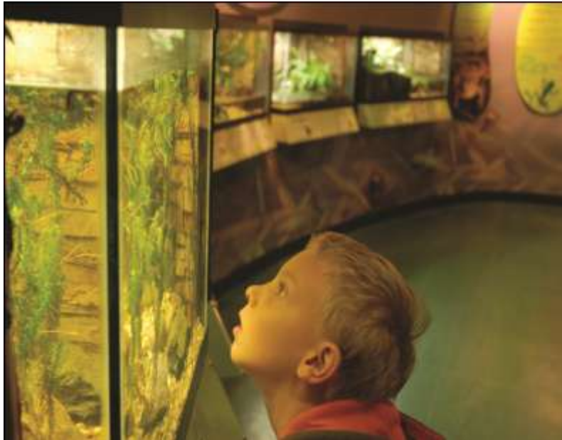
© إنا السورث , ديليو ديليو تي