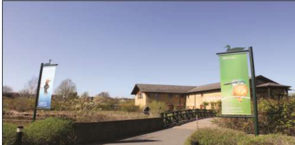
مدخل مركز لندن للأراضي الرطبة

إن التطوير أو الوضع الحساس ل مركز التثقيف بالأراضي الرطبة يتيح المجال للمنظمة لإظهار الابتكارات/الأفكار الجديدة و 'لممارسة ما نصحت به'. إذا كانت التأثيرات لا يمكن تجنبها أبداً و يتطلب الأمر تخفيفها فإنه يجب تعويض تكلفة التخفيف ليس بالفوائد المرتبطة بالحد من التأثير فحسب وإنما أيضاً بفرصة استخدام التخفيف كفرصة للتعلم والاتصال. ويمكن أن تشمل هذه الابتكارات إنشاء أراضي رطبة لتخفيف مخاطر الفيضانات أو لمعالجة مياه الصرف الصحي، أو تصميم أسطح خضراء لتوفير الموائل أو لعزل المباني، أو إنشاء مباني عائمة أو مقامة على ركائز لتخفيف الفيضانات أو لتسهيل البناء في السهول المعرضة للانغمار بمياه الفيضانات، أو تصميم نوافذ ذات شرفات أو ستائر لتقليل انعكاس السماء و تقليل مخاطر اصطدام الطيور. و تترجم المراكز كل هذه المناهج إلى رسائل صون بحد ذاتها (انظر الفصل 5).