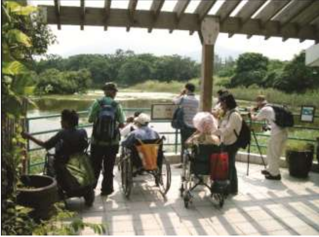
مراكز الأراضي الرطبة يجب أن تستقبل شريحة واسعة من الزائرين

* العوائق الحسية: الزوار الذين يعانون من صعوبات بصرية أو سمعية