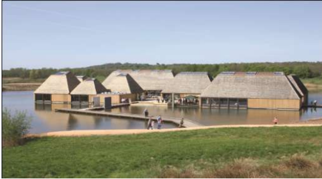
قرية الزوار في محمية بروكهولز الطبيعية

ومن أحد الصلات الرئيسية التي تتطلب تخطيط و إدارة بالغة الدقة هي منطقة الربط بين المساحة الداخلية والمساحات الخارجية. حيث تقدم مناطق الربط هذه مشاهد مغرية لما يتوقع الزوار أن يجده إذا ما توغلوا في الموائ البرية أكثر. إن مناطق الربط بين المناطق الداخلية والخارجية للمركز تتطلب دراسة متأنية وينبغي أن تكون في طليعة التخطيط لمكان المركز و مرافقه والأنشطة التي سوف تقدم والتهديدات التي قد تشكلها على موائ الحياة البرية الحساسة.