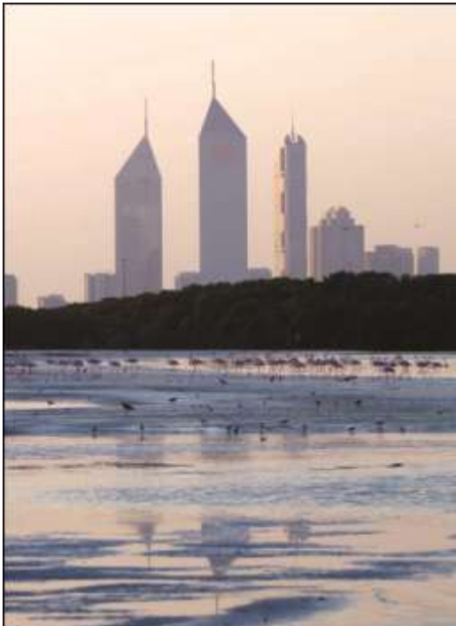
مسطح مائي أثناء وقت الجزر في موقع رامسار برأس الخور مع خط سماء مدينة دبي

تعتبر الأراضي الرطبة والموائل المرتبطة بها عناصر أساسية في نجاح مركز التثقيف بالأراضي الرطبة (راجع الفصل 4) فهي المكون المادي الجوهرية التي من خلالها يتم تحقيق التثقيف وتبليغ الرسالة بأساليب ممتعة ومثيرة للذكريات. وعلى الرغم من أن الأراضي الرطبة والحياة الفطرية التي تدعمها حساسة لأي اختلال وتتطلب إدماج مدروس إلا أن إصلاح الأراضي الرطبة وإنشاء أراض رطبة جديدة يتيح فرص للمشاركة في التجارب التعليمية و