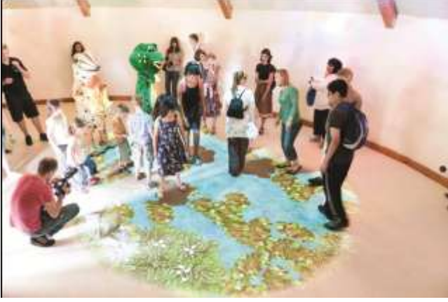
لعبة البحيرة التفاعلية التابعة ل دبليو دبليو تي

يجب أن يكون الهدف النهائي لمركز التنقيف بالأراضي الرطبة هو تغيير السلوكيات وذلك سعياً وراء تحقيق الاستخدام الحكيم للأراضي الرطبة وصونها، ويجب أن يكون لجميع أنشطة العروض و الوسائل التفسيرية والمعارض ثلاثة أنواع من الأهداف: