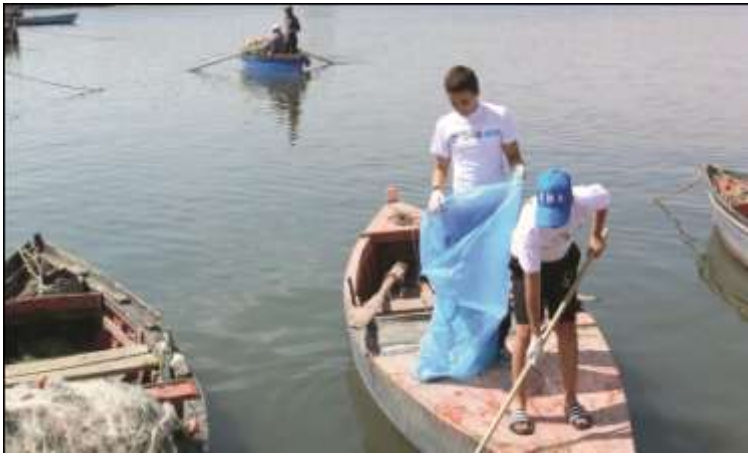
طلاب مدرسة المتطوعين ينظفون مستنقع غار الملح ، تونس

على الرغم من أن صون الأراضي الرطبة يجب أن يكون الاختصاص الأساسي للمركز إلا أن هنالك العديد من المواضيع البيئية تتعلق بالاستدامة طويلة الأجل لموارد الأرض. حيث أن جعل العمليات