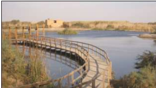
محمية الأرض الرطبة الزرقاء المدارة من قبل المجتمع الملكي لحماية الطبيعة (الأردن)

وتتم إدارة مراكز التنقيف بالأراضي الرطبة من قبل الحكومات والمنظمات غير الحكومية والأفراد والشركات أو من خلال شراكة أي من تلك المؤسسات مع بعضها. وقد تكون المراكز صغيرة تعتمد على المتطوعين من المجتمع المدني أو تكون مشاريع ضخمة تدعمها الحكومة المركزية أو المحلية.