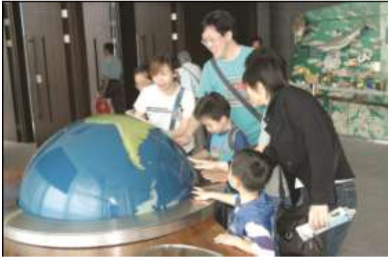
المعرض العالمي في هونج كونج

*الحسيون: الأشخاص الذين يشعرون بروابط عاطفية مع البيئة الطبيعية والذين يبحثون عن الطمأنينة الخارجية والجمال و/أو مشاهد الحياة الفطرية ولكن ليس بالضرورة أن يكونوا على علم بالكثير من الأنواع والموائل المختلفة.