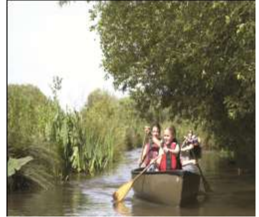
غابة كانو التابعة ل دبليو دبلوي تي

وعند النظر في الموازنات التشغيلية من المفيد تنويع مصادر الدخل بقدر المستطاع وقد يتضمن ذلك عناصر مثل الرسوم على دخول المركز والعضوية السنوية والعوائد من المطاعم والمحلات. ومن وسائل زيادة الدخل التشغيلي هو النظر في مجموعة من الخيارات المتعلقة بالدخل. فمثلاً يمكن الحصول على دخل من خلال جملة من المصادر كتأجير القاعات للفعاليات والوظائف الأخرى والاجتماعات ورعاية الحياة الفطرية وإدارة أيام الأنشطة للمؤسسات أو تأجير البنايات والمساحات الأخرى أو تأجيرها من الباطن مثل استخدام الأراضي للمشاتل الزراعية.