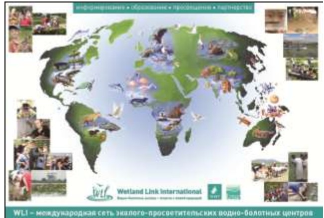
النسخة الروسية لكتيب الرابطة العالمية للأراضي الرطبة