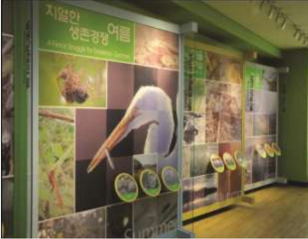
قاعة العرض بحديقة إبو للنظم الحيوية ، كوريا

إن العروض و الوسائل التفسيرية هي عملية بها ومن خلالها يمكن أن تقوم مراكز تعليم الأراضي الرطبة بإثارة و"ربط" الزوار بالطبيعة. و العروض التفسيرية ليست شبيهة بالمعلومات على الرغم من أن توفير المعلومات هو جزء من أي خطة لعروض ووسائل تفسيرية.