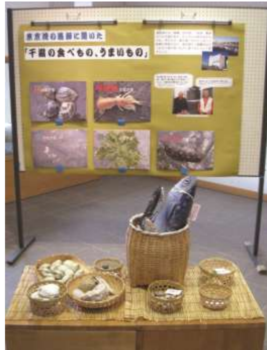
عرض تثقيفي بموقع رامسار ياتسو-هيجاتا ، اليابان