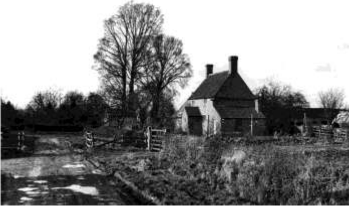
دبليو دبليو تي سليمبريدج في بدايته المبكرة

وترغيبهم في المحافظة على الحياة الفطرية منذ عام 1946 وكذلك أنشأت جمعية أودوبن الوطنية بالولايات المتحدة الأمريكية أول مركز لها في عام 1923 وهو محمية ثيودور روزفلت ومركز أودوبن بالقرب من نيويورك في مدينة أويستر باي..