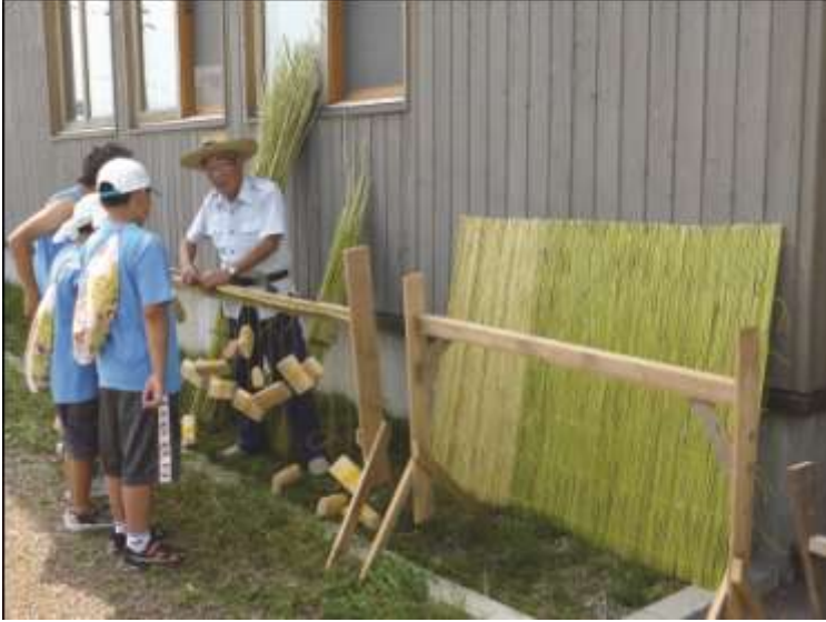
متطوعون يصنعون حاجز من القصب في مياجيماتوما ، اليابان

يجب أن يكون طموح أي مركز أكثر من مجرد الحصول على عدد معين من المتطوعين و إنما يجب أن يكون الهدف زيادة أعداد وفئات المتطوعين وتحفيزهم. وتتنوع الأشياء التي تحفز مختلف المتطوعين. ويعد خلق ظروف وبيئة عمل مناسبة أمر ضروري. ولكن كل المتطوعين هم أفراد يمارسون خياراً فردياً. كما أن معرفة الحوافز الشخصية يعتبر أمر ضرورياً للحصول على أقصى استفادة من هؤلاء الأفراد المتفانين.