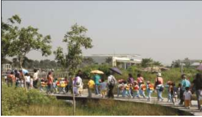
حديقة الأرض الرطبة في هونج كونج

سوف تقوم بعض مراكز التنقيف بالأراضي الرطبة بإعداد برامج لأطفال المدارس حيث يمكن أن يكون التركيز على تقديم الأهداف ضمن المناهج الدراسية الوطنية، وسوف تقوم العديد من البرامج بإشراك مجموعة كبيرة من الجمهور، والمسائل الرئيسية هي أن تكون مبدع وتتأكد من أن مجموعة البرامج تلبى مجموعة من احتياجات الزوار.