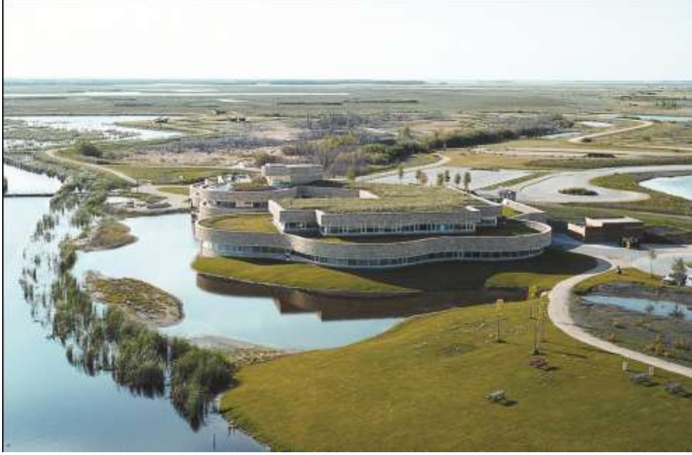
صورة جوية لمركز مستنقع أوك هاموك للتفسيرات , كندا

أحيانا قد يحدث حالات من التوتر بين فئات الزوار المختلفة. كيف يمكن للمركز تقديم الأمان والهدوء في مخاباً مشاهدة الطيور مع توفير مناطق اللعب التفاعلية للأطفال المتحمسين؟ كيف يمكن تمكين الوصول إلى المركز دون إزعاج الحياة البرية؟ كيف يمكن أن لا تؤثر المخلفات والتلوث - التي يتم إنتاجها حتى في المراكز التي لديها مساعي طبيعية بهذا الشأن أو التي لا تعتمد إنتاجها - على الحياة البرية الحساسة؟ كل هذه التوترات و غيرها الكثير تستدعي النظر.