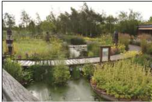
حديقة المطر بمركز الأراضي الرطبة في لندن

لكل مركز من مراكز الزوار ال تسعة التابعة لمنظمة المملكة المتحدة للحفاظ على الطيور البرية والأراضي