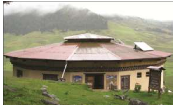
مركز المعلومات المدار بواسطة المجتمع الملكي لحماية الطبيعة في منطقة محمية فوجيكا (بوهتان)